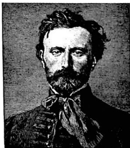
Jindřich Fuegner, narozen 12. září 1822. Zemřel 15. listopadu 1865.