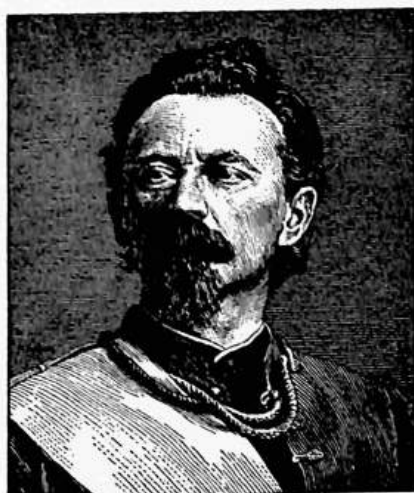
Dr. Miroslav Tyrš, narozen 17 září 1832. Zemřel 8. srpna 1884.