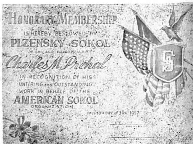
Diploma of honorary membership.

At a meeting held on January 10, 1957 a Certificate of HONORARY MEMBERSHIP was pre-