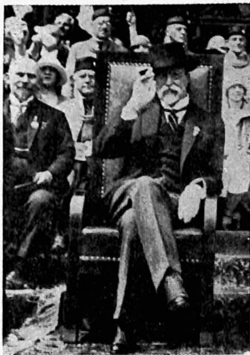
President T. G. Masaryk na VIII. sletu v Praze.

Office: 2345 South Kedzie Avenue, Chicago 23, Illinois