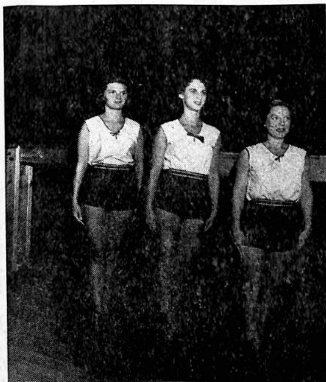
I High Div. Women Sokol Tabor