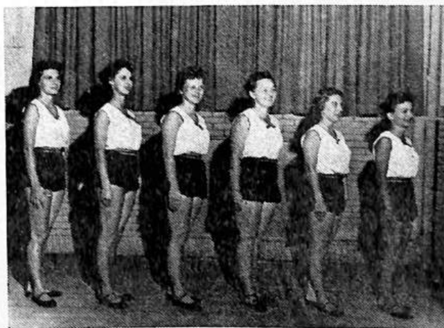
I Team Volley Ball Sokol Tabor

Same as Exercise 6, but whole body is raised free from floor - entire weight resting on hands and toes.