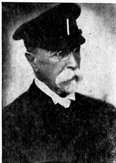
THOMAS G. MASARYK, President-Liberator of the Czechoslovak Republic