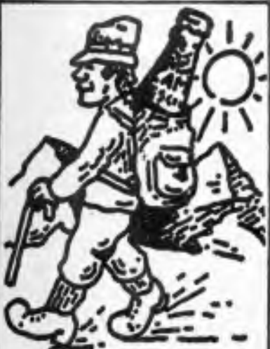
Mit Campari ist Wandern ein doppelter Genuss.

Poole přehrauy Lago di Livigno, zamrzlé a téměř bez vody, si náš automobil klestí cestu dál na úzké silnici nad jezerem a pod nekonečnými kamenitými poli hory Piz da l'Acqua. Po vodě tu ovšem není ani památky, je to jen strmá kamenitá poušť.