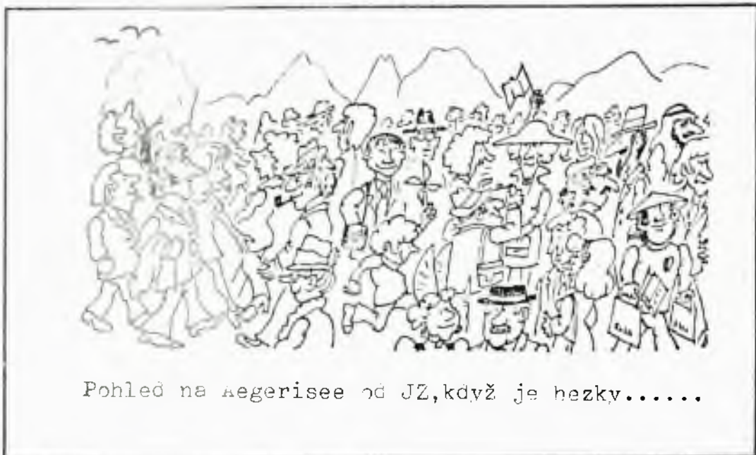
Pohled na Aegerisee od JZ, když je hezky.....