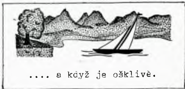
.... a když je ošklivě.

Kežlopádne si přesto pamatujme pro budoucnost: TOHO BOHLÁ NEBOUĚ, ABY NĚKDO NA TABOŘE ŠPATNOU NÁLADU MEL !!!