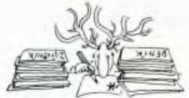
Bratr Jelen si píše....

Je jisté, že to je k dostání jen na skautském táboře, nikdy ne se školou, cestovní kanceláří, rodiči a podobně. Co se programu, čtyř pracovitosti i počasí týče byl