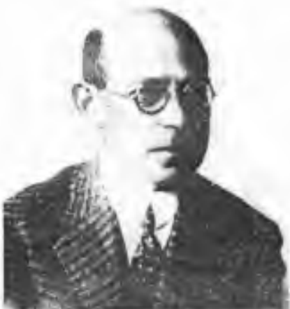
Spisovatel Rudolf Těsnohlídek, který popsal příběh malé Lidušky

Stalo se to už před více než sedmdesáty léty v předvečer Štědrého dne v Bílovicích nad Svitavou, v obci vzdálené jen několik málo kilometrů od Brna. V té době tam bydlel básník a spisovatel, redaktor časopisu Moravský kraj - Rudolf Těsnohlídek. Miloval tento kousek moravské země, toulával se rád po lesích, navštěvoval přátele.