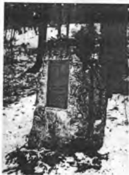
Památník děvčátka odloženého na prahu vánočních svátků v lese