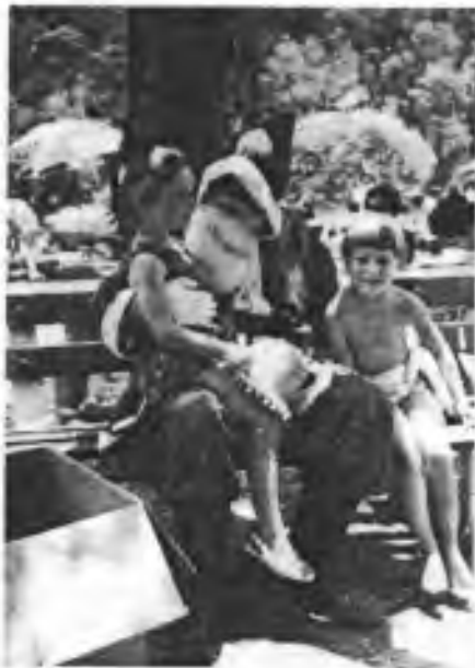
Vánoční muž jistě dětem závidí jejich obíčení

Češi zůstali u svých zvyků a čekají se štědrovečerní večeří na první hvězdu. Australské vánoce mají málo společného s českými, s těmi prvními v Betlémě, však oproti našim to, že jsou v létě, protože betlémské vánoce nebyly určitě bílé.