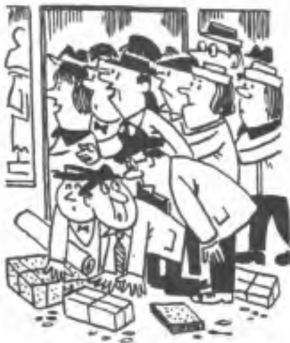
Tak koukám, souseda, že jste se také rozhodl pro předvánoční nákup již nyní, dokud nejsou takové névaly