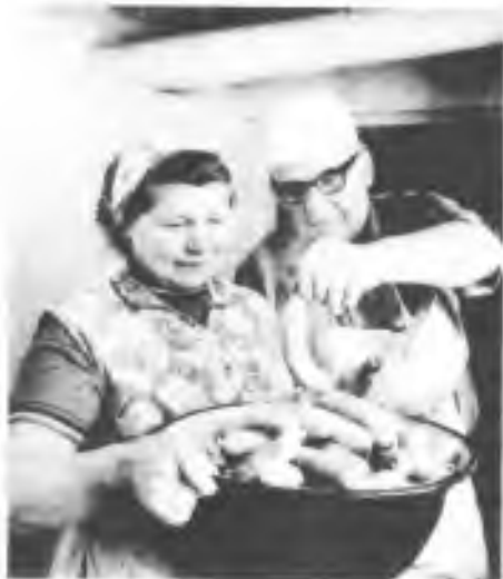
To bude pochutnání!

Čas domácích zabijaček patřil neodlučně k životu na našich vesnicích v minulosti, a není tedy divu, že zabijačky inspirovaly výtvarné umělce, například Josefa Ladu, i spisovatele.