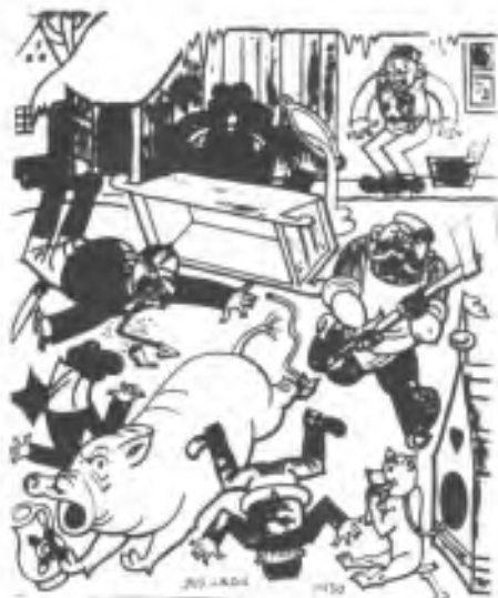
Jedna z Ladových zabijaček