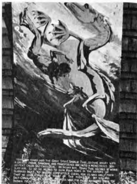
Pověst o mořském draku

Za starých časů nebyly ostrovy podle pobřeží, a všechny kmeny žily a lovily pospolu v lesích na pevnině. Stále se však mezi sebou hašterily a válčily. Sagalie Tye, Veliký Duch, se na ně rozlobil a vzal do dlaní kusy země a skal z pobřeží a naházal je do vody. A proto je tolik ostrovů okolo pobřeží, a kmeny žijí na nich odděleni mořem jeden od druhého, aby nemohli mezi sebou válčit.