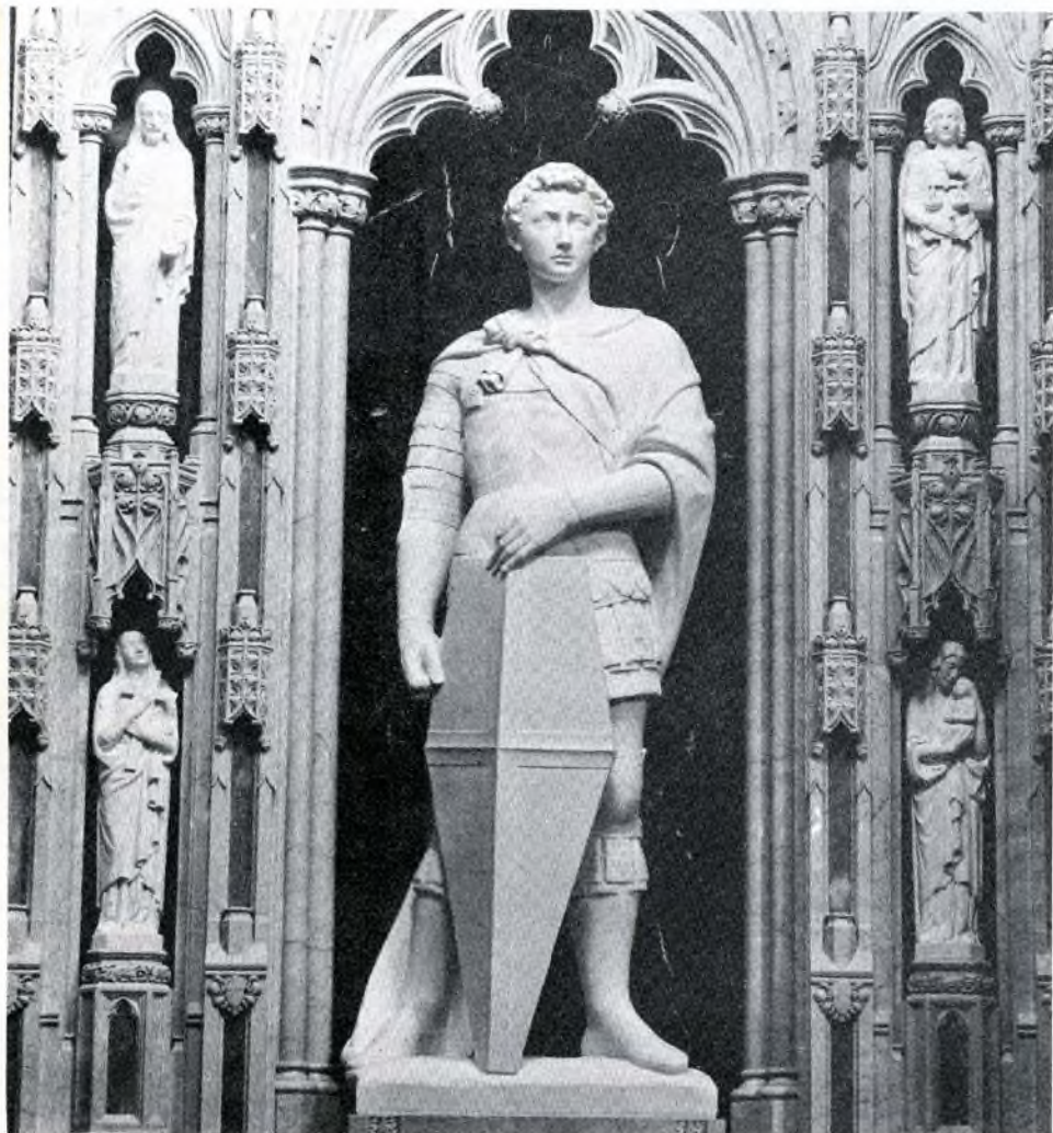
DONATELLO : SV. JIRÍ