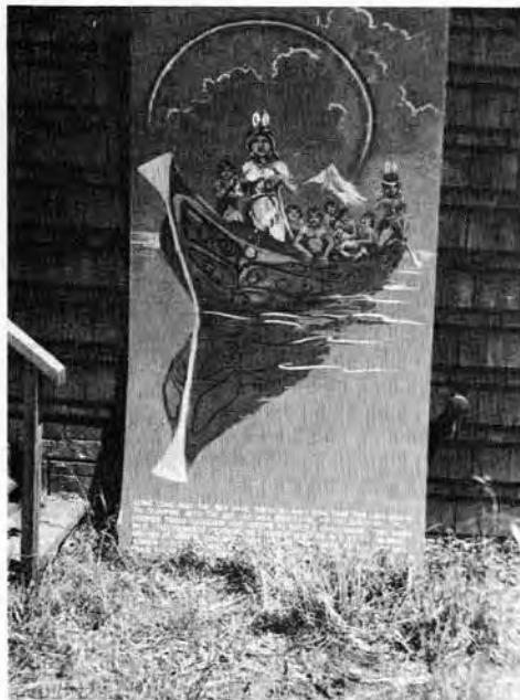
Pověst o potopě

Překlad nápisu pod obrazem zní: Dávno, dávno začalo najednou tolik pršet, že země mizela v moři. Na jezeře Krás v severní zátoce se sešly stíněné kmeny a rozhodly se postavit veliké canoe. Daly do něj nejmladší matku, nejstatečnějšího mladého bojovníka a všechny děti. Pak spustily člun na vodu. Měsíce a týdny byli na moři, až jednoho rána slunce zase vysvitlo a vody začaly opadávat. První pevnina, která se objevila byl Mount Baker, jak my tuto horu nazýváme, kde canoe zakotvilo. (Je zajímavé, že pověst mluví jen o psu, kterého vzali s sebou, a zmiňuje se také o duze na obloze. Nevysvětluje však, proč nastala potopa, ač v jiných pověstech "zloba bohů" nebo Boha se často vyskytuje).