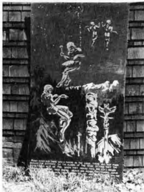
Pověst o souhvězdí Pleiades

Indiánské pověsti Západu jsou bohužel velice málo zachovány a jsou přepisovány lidmi, kteří neměli pravý poměr ke kultuře "divochů". Bud to byli misionáři, kteří viděli v nich jenom zbytek pohanství a nezajímaly se o ně, nebo docela vědomě je chtěli vykořenit a nahradit křesťanskými pověstmi, nebo to byli nevzdělaní lidé, kteří o takové pohádky neměli pochopitelně zájem. Sli hledat kožešiny a zlato. Dnes je málo Indiánů, kteří by ještě něco z toho znali, ačkoliv je to jen osmdesát let, co je pobřeží skutečně obýdleno bělochy. Ztratili svoje zřízení, byli konfinováni v rezervacích, žijí umělým životem a jejich touha je civilizovat se a zapomenout na vlastní kulturu, která je jim stále předhazována jako divoštvi, a stát se rovni bělochům. Ovšem těm, s nimiž přicházejí do styku, a kteří také nemají tradice ani kultury, tím méně náboženství. Jejich kulturou je lednička, slágr na gramofonové desce, a jejich Bůh je v třech božských osobách "dolar, dime a cent".