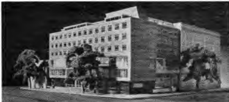
Takhle má vypadat Baden-Powellův dům po dokončení.

* Slova posvěcení základního kamene: anglicky