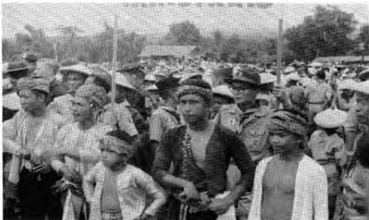
Tanečníci připravení k výstupu v aréně

Australští skauti slavnostně předali filipínským bratřím semena různých