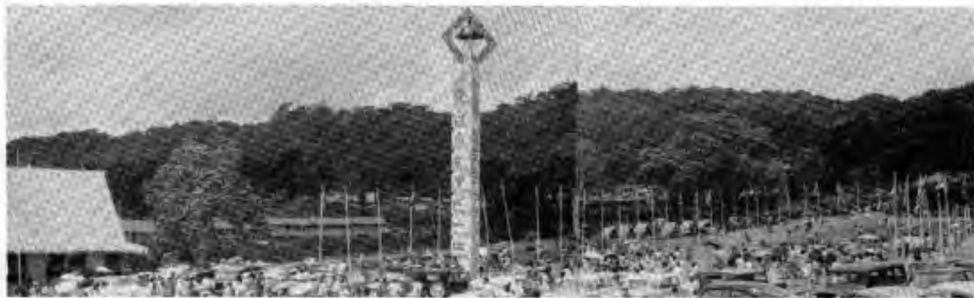
Odpolední ruch na Náměstí bratrství

Program zahájili skauti z Cambodie , kteří měli na sobě podkasané kalhoty jasných barev. Zpívali písně při dobrovodu kytary. - Japonské vystoupení bylo nejbarvitější: přes 500 hochů v kimonech, obis a happi (kabátce duhových barev) předvedlo typickou náboženskou flestu zvanou omikoshi (Shinto festival slavený v měsících březnu, dubnu a říjnu), nesouce na ramenou 6 malých svatostánků a chraptivě zpívajícíek úderu bubnů zvaných taikos; předvedli také dračí tanec a jiné národní písně a tance. - Potom 30-členný orchestr z Indonesie , jehož členové byli oblečení v batik a hráli na tradiční nástroje "angklung" (nástroj z čistého bambusu, vyluzující hudbu podobnou klavíru) zahrál