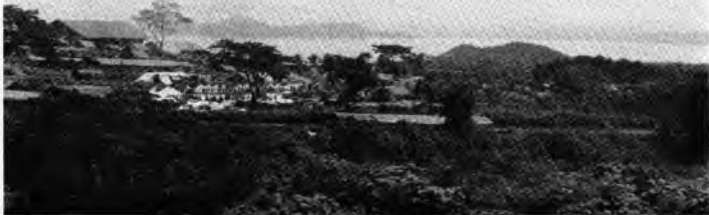
Pohled na podtábor "Západní Visayas" z tábora "Filipinos" (V pozadí jezero Laguna de Bay)