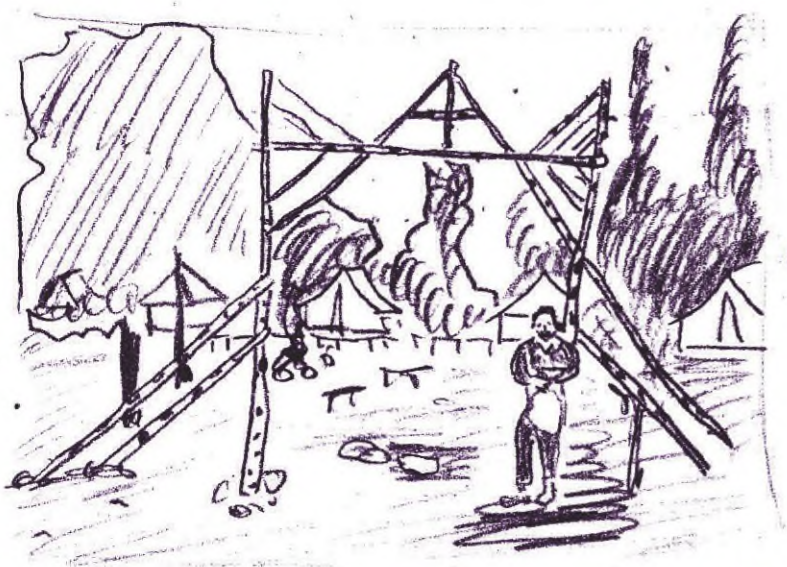
TÁBOR ČESKÝCH DĚTÍ U MONTREALU ČERVENEC - SRPEN 1963

Maruš poslala fotografii tábora, kterou dobře nelze tímto způsobem reprodukovat. Pripojená kresba bude muset splnit stejný úkol. Fr.