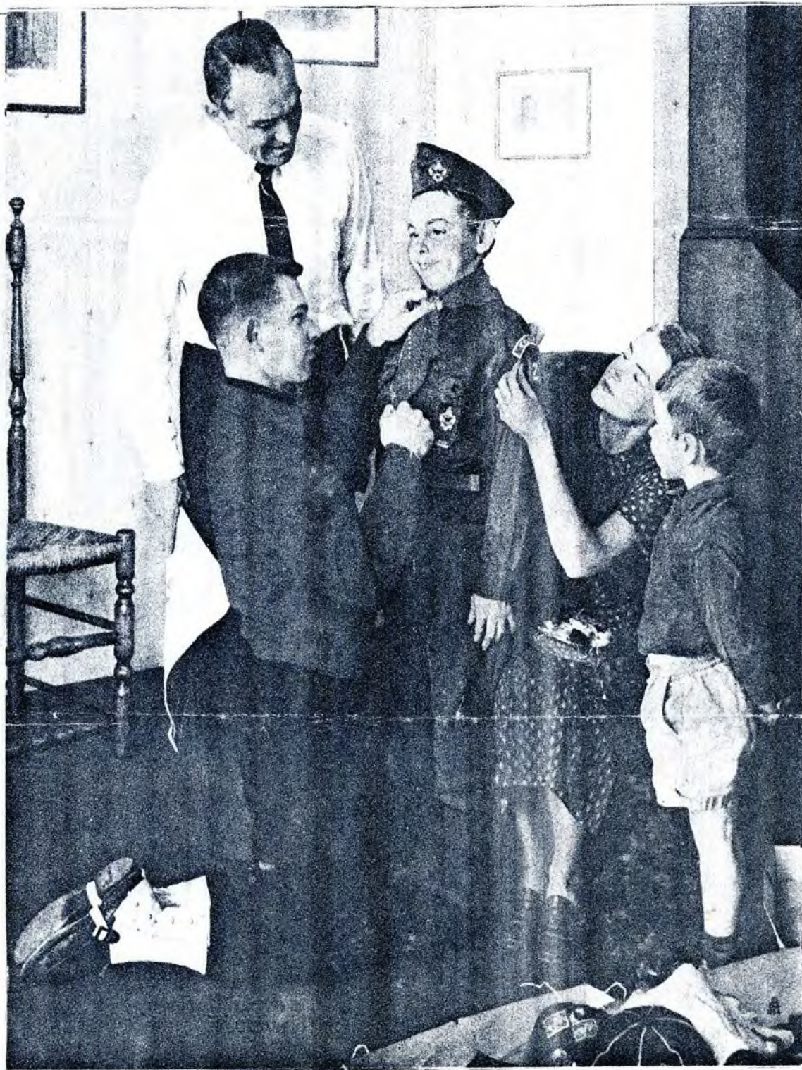
PRVNÍ DEN V SKAUTSKÉM KROJI

ČASOPIS ČESKOSLOVENSKÝCH SKAUTŮ A SKAUTEK V EXILU Zpráva č. 14.