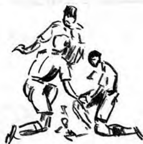
už to horí