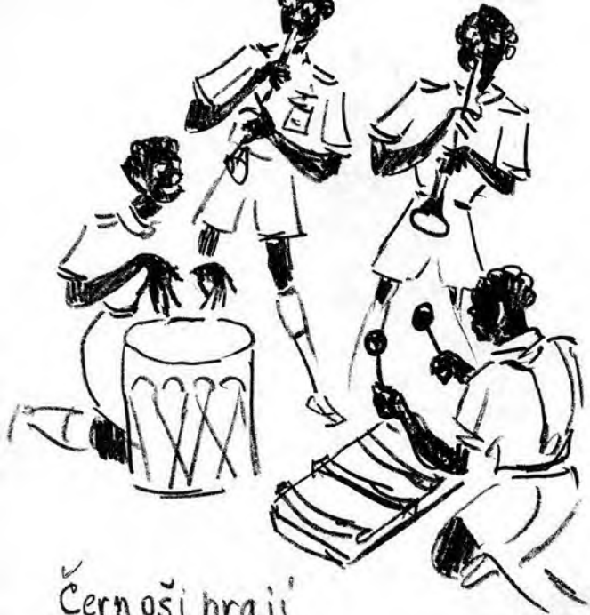
Černoši hrají Poštorenskou kapelu