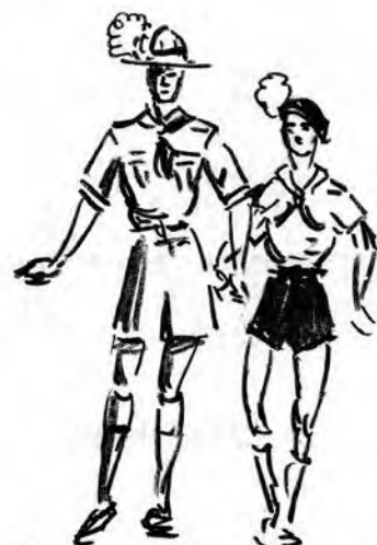
Švéd a Francouz z Gödölö