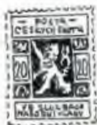
ŘÍJEN 1918 - PRAHA

Chcem věrni zůstat také dál ČASOPIS ČESKOSLOVENSKÝCH SKAUTŮ A SKAUTEK V ZAHRANIČÍ Č. 22.