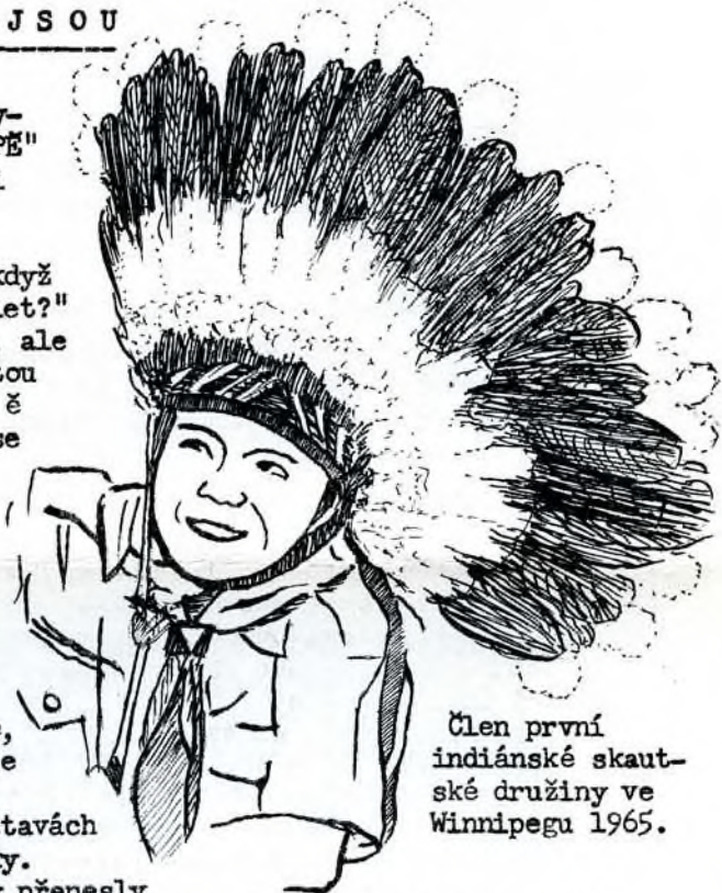
Člen první indiánské skaut- ské družiny ve Winnipegu 1965.

Víc jak před 100 lety hlásil se biskupovi kdesi v Jugoslavii mladý kněz, který chtěl pracovat mezi severoamerickými Indiány. Když se stal konečně misionářem, nedal si pokoje, dokud se osobně neseznámil s každým Indiánem, který náležel do jeho misijního území. To však předpokládalo naučit se několika indiánským jazykům, nedbat na třeskutou zimu ani na vlhké vedro, na sníh, na komáry a na nebezpečí všeho druhu. Dopravní prostředky, kterých na svých častých cestách používal, budily by závist u všech kluků, ale on sám dobře věděl, kolik obětí a utrpení vyžadovaly pochody na sněhových "botách", na saních tažených smečkou psů, s veslem v ruce v kolébaté březové kanoi a hřbetě indiánských koní.