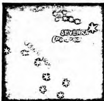
ORIENTACE PODLE HVĚZD

Jak je tomu ale v noci? Vzpominate si jeste ze skoly neco o hvездach? Je to Severka, ktera nam pomuze nebot lezi primo na severu.