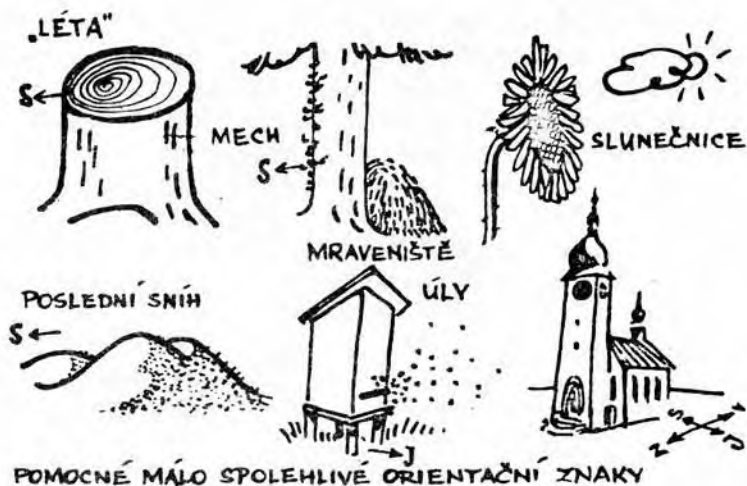
POMOCNÉ MÁLO SPOLEHLIVÉ ORIENTAČNÍ ZNAKY

Na stranich a strechach obracenych na jih, snih roztava nejdrive.