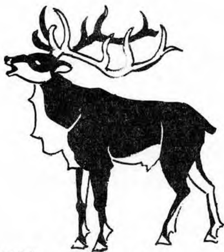
JELEN ELK WAPITI