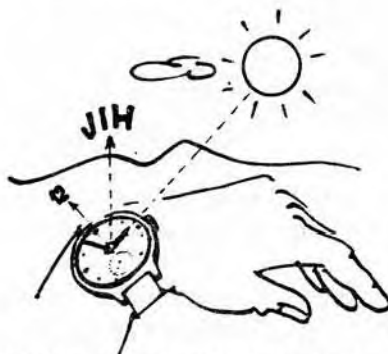
ORIENTACE PODLE SLUNCE A HODINEK

Jine ovsem vice mene priblizne urcovani stran je mozne dle hustsich let na parezech (sever), podle mech a lisejniku na kamenech. V tomto pripade je nutne jeste jedno urceni, nebot lisejniky a mech je na strane, kde vice fouka vitr.