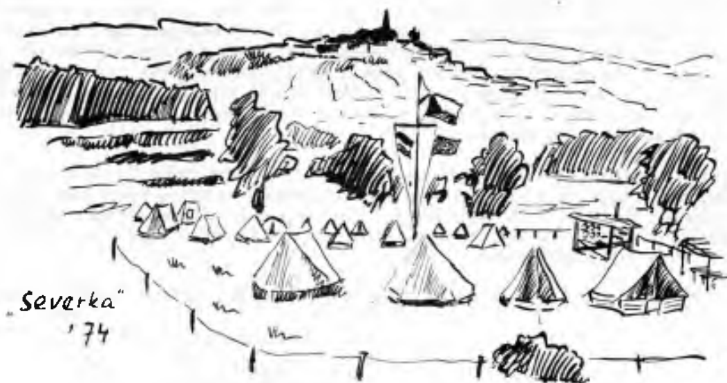
T Á B O R " S E V E R K A 7 4 "