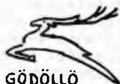
GÖDÖLLÖ MADARSKO 1933