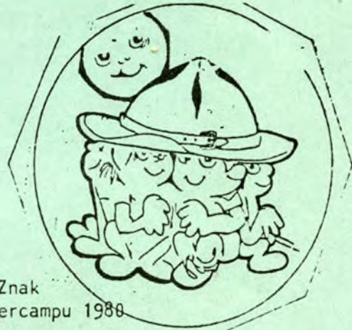
Znak Intercampu 1980