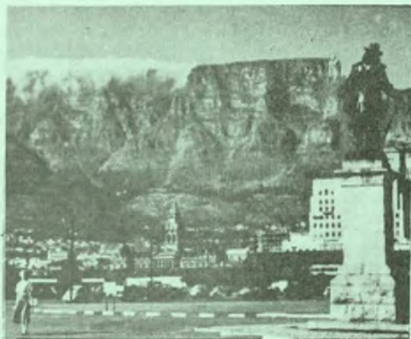
CAPE TOWN. Louis BOTHA, Statesman

Nebyli jsme v Johannesburgu, ale Durban, Port Elizabeth, Cape Town jedinecne pristavy, jsou deahokamy Unie, kde v te dobe, zivot byl spokojeny pro vsechny obyvatele, nadbytek, takže Unie zasobovala potravinami okolni stavy - jen olej jim schazi a ten vsak mohou si koupit kdekoliv za jakoukoliv cenu, - maji nadbytek zlata a diamantu!