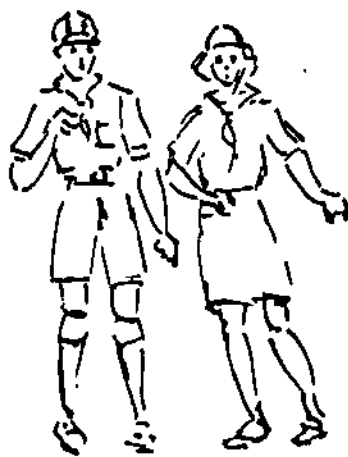
Kam vás dáme?