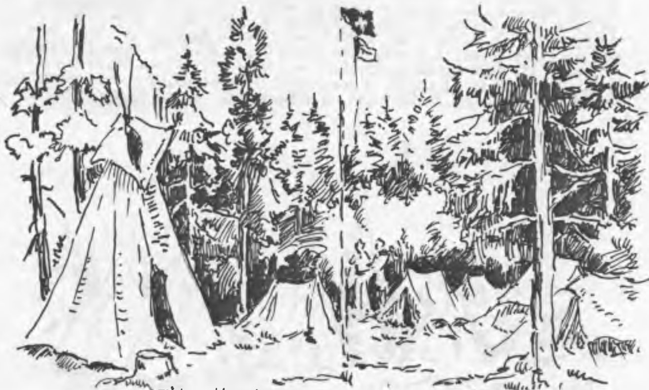
Tábor Varuša 1982 na Innu