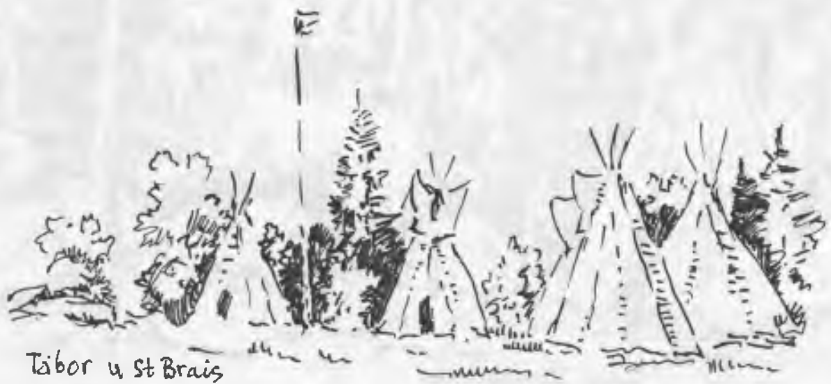
Tábor u St. Brais 1981

V r. 1963 se vrací k velkému formátu. Vysla čísla 1,2,3,4. V r. 1964 čísla 5,6,7,8, a v r. 1965 čísla 9,10,11,12, a pak pokračuje v Chicagu v r. 1966 číslem 13 a v r. 1967 čísla: 14,15,16, 17 a v r. 1968 čísla 18,19,20,21,22 a v r. 1969 čísla 23,24 v r. 1970 se STOPA přestěhovala do Los Angeles kde ji vydávali dále roveři v r. 1970 číslo 25, v r. 1971 čísla 26,27,28, 28 v r. 1972 čísla 30, 31, 32,33 a v r. 1973 čísla 34,35,36,37 a v r. 1974 čísla 38 / dvě vydání / 39,40, a 41. v r. 1975 čísla 42,43,44,45. a v roce 1976 čísla 46,47,48,49, v roce 1977 čísla 50,51,52,53, 1978 čísla 54,55,56,57 a v roce 1979 čísla 58,59,60. v roce 1980 čísla 61,62,63, v roce 1981 čísla 64,65,66 v roce 1982 čísla 67,68,69, v r. 1983 čísla 70,71, a v roce 1984 čísla 72,73.