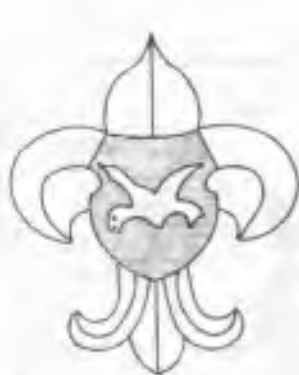
Skautská organizace tělocvičné jednoty " O r e l "

Pokračujeme v odznacích z let první republiky, tentokrát skautských organizací dvou církví :