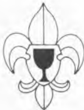
Odznak UES - Ústředí evangelických skautů, založeného r.1937, rozpuštěného 1939.