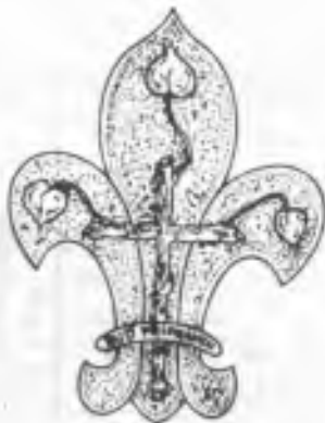
Katoličtí skauti RČS