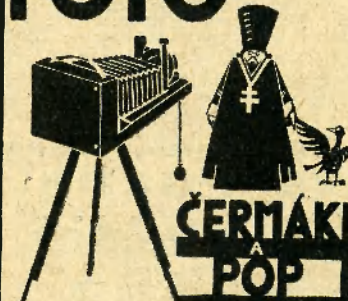
FOTO APARATY POTREBY Fotografujte! Váš aparát je pro Vás připraven.

Dáme Vám na něj stálou záruku a právo bezplatné opravy zdarma.