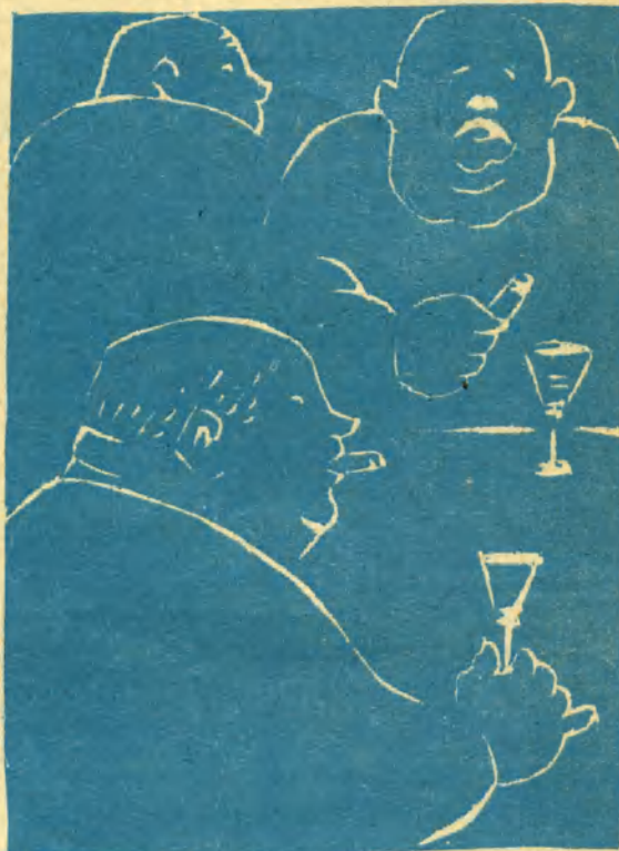
(Z něm. časopisu „Der Vagabund“.)

— Tak videj, matko: Už zase jsou zanešený na policii!