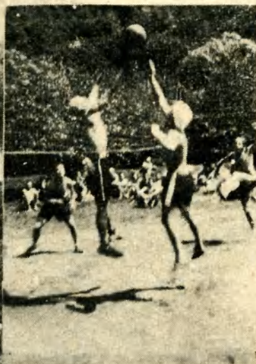
Z naší volleyballové soutěže.