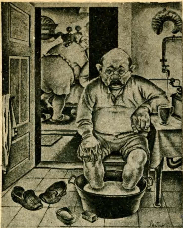
Takovejhle život by mi moh bejt ukradenej.