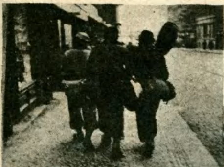
Jdeme ze sleziny.