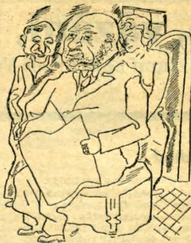
Naděždíčko, už nám zase zranili třináct čemíků,

— Hele, jak si to představuješ, říkat veřejně, že sem blbec.