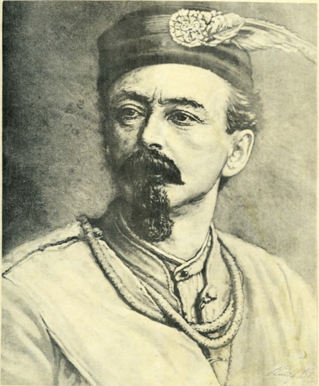
DR. MIROSLAV TYRŠ ZAKLADATEL SOKOLA