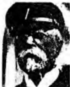
Povinnosti k bližnímu a národu.

Dobry dělník není méně hodny než dobry prezident.