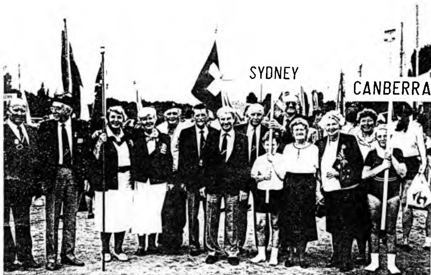
Účastníci z Austrálie na sletu v Paříži

Ve světě je stále v popředí střední východ. Obsazení Kuwaitu Irákem pohnulo k nevídanému zásahu Společnost národů s požadavkem odchodu iráckých vojsk a náhradě všech škod. Vojenský zásah je nevyhnutelný!