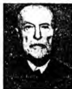
Povinnosti k lidstvu a nekonečnu.

— Když miluješ svou vlast, nesmiš o tom mluvit, ale udělej něco kloudného.