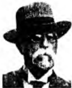
Povinnosti k sobě.

Šťastný je ten, kdo má lekary obsah životní, šťastný je ten, kdo dovede poctivým usilím aspoň zčásti uskutečnit svoje ideály.