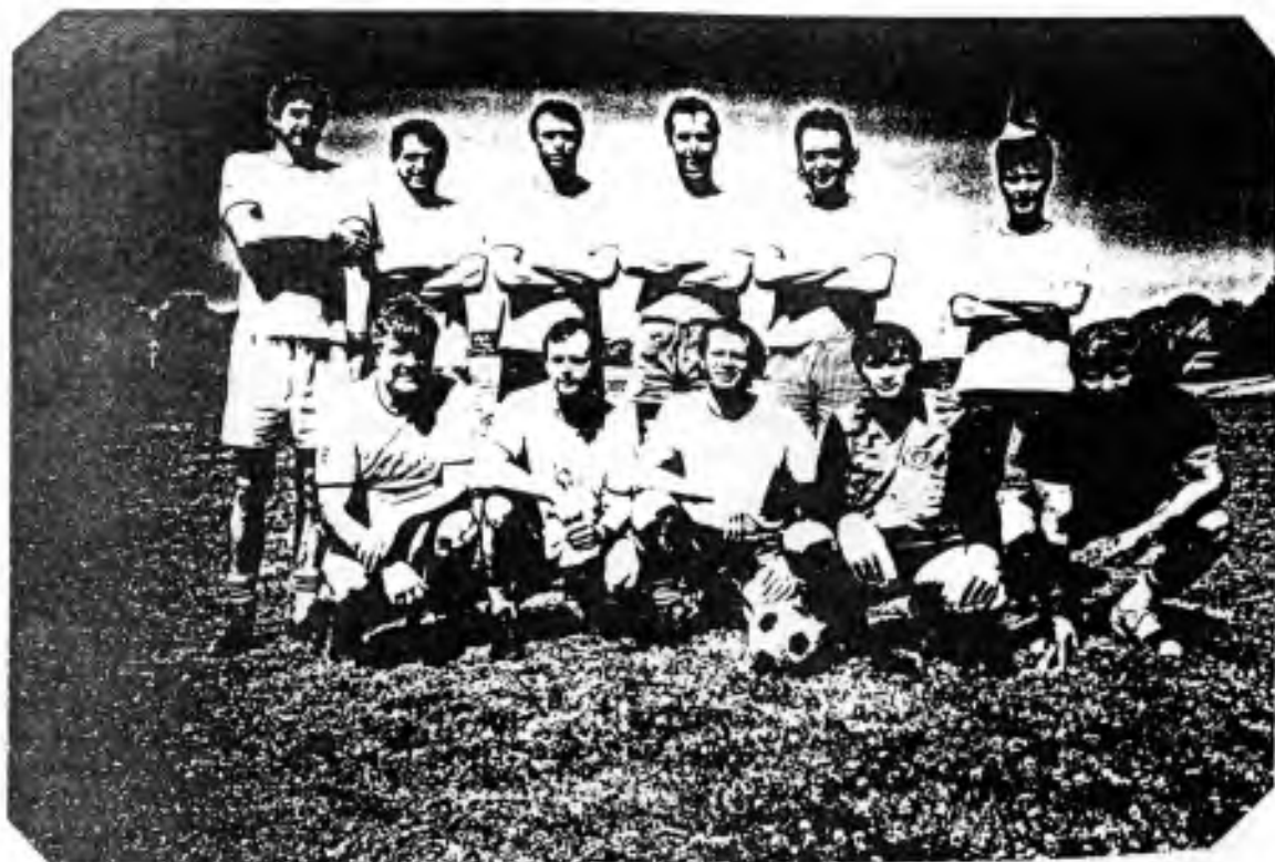
KLABZUBOVA JEDENÁCTKA - SOKOL -

Členové našeho nohejbalového a "in-door soccer" oddílu zorganizovali na neděli 29. září 1991 první přátelský zápas mezi jedenáctkou Sokola Sydney a jedenáctkou sousedského Rakouského Klubu. Zápas se hrál na hřišti naproti od naší sokolovny od 10 hodin ráno, dvakrát po 30 minutách. Rakouský klub se ujal vedení v 5té minutě a Sokol Sydney /Klabzubova jedenáctka/ vyrovnal brankou 5 minut před koncem. Výsledek 1:1 dobře vystihl úroveň hry obou týmů a doufejme, že toto je začátek dalšího rozvoje našich sportovních "mezinárodních" stvků. WELL DONE BOYS!