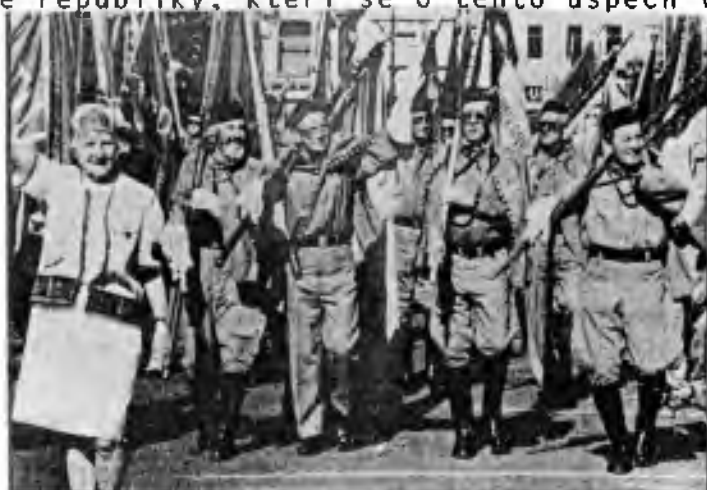
XII. všesokolský slet zahájil mohutný průvod

Moje velké díky také patří všem sestrám a bratrům z ČOS a sokolům České republiky, kteří se o tento úspěch všemi silami přičinili!