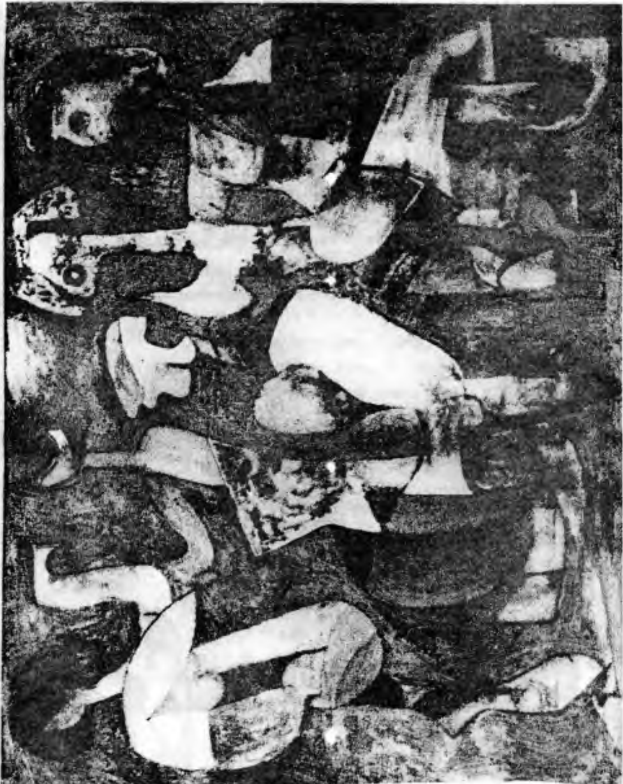
Čestmír Borkert : Slučivost v radosti - obraz předaný prezidentu Havlovi sydneyskými umělci při návštěvě sokolovny.

s ukázkami výtvarných děl umělců narozených v Československu. Výstava byla zahájena 12.dubna 1995 a potrvá do 18.května 1995. Výstava je otevřena denně od 10.00 do 18.00 hodin v prvním patře Seymourova divadelního centra, v Sydneyské universitě, na rohu ulic Cleveland Street a City Road.