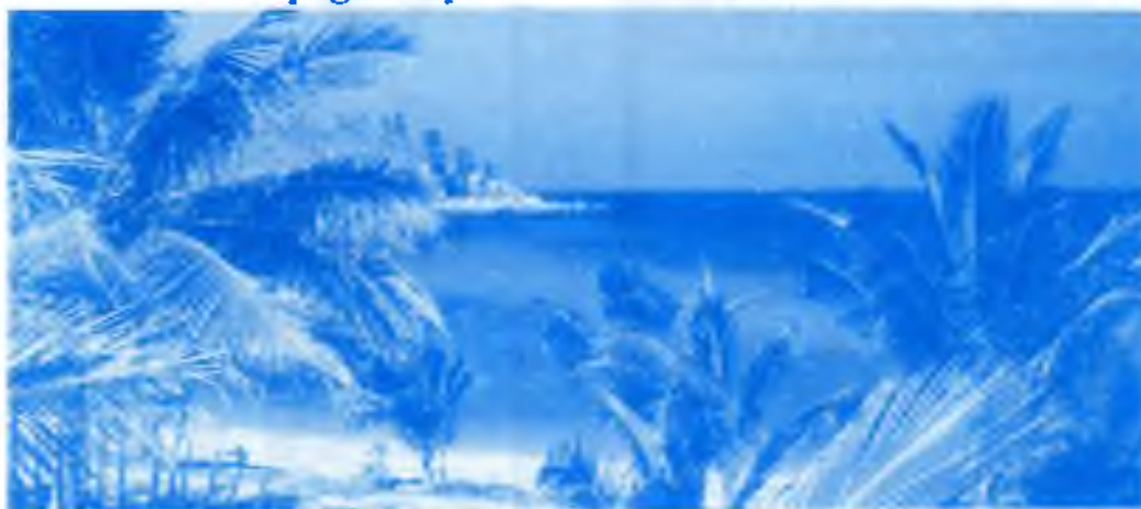
Pohled z okna bytu

Webpage: http://web.one.net.au/~transworld