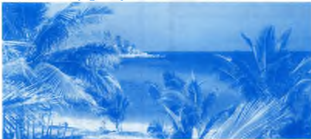
Pohled z okna bytu

Webpage: http://web.one.net.au/~transworld