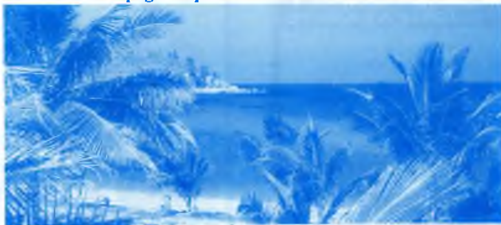
Pohled z okna bytu

Webpage: http://web.one.net.au/~transworld