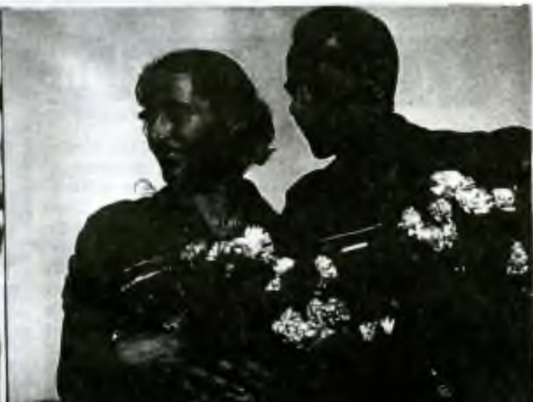
Dana a Emil v době největší slávy na OH v Helsinkách. On vyhrál všechny tři vytrvalecké běhy, ona hod oštěpem.