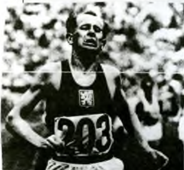
První olympijský triumf. Při běhu na 10 km v Londýně 1948 utekl všem soupeřům.