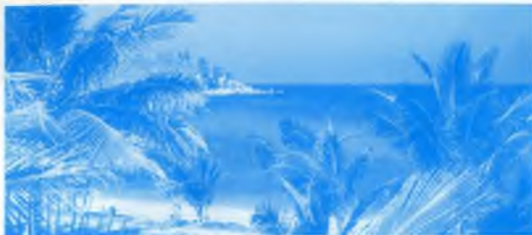
Pohled z okna bytu

Virgin Blue létá Sydney-Brisbane-Townsville a zpět za $ 304