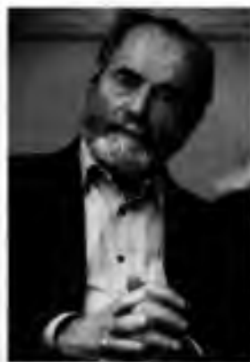
Pavel Tigríd

Po pádu komunismu se Tigríd stal blízkým spolupracovníkem tehdejšího prezidenta Václava Havla. V letech 1994 až 1996 obsadil ve vládě tehdejšího premiéra Václava Klause křeslo ministra kultury. Po odchodu z politiky žil střídavě ve Francii a v České republice.