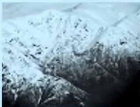
Krásné tatranské prostředí.

Plně zařízený byt pro 4 osoby k pronájmu - 2 ložnice.