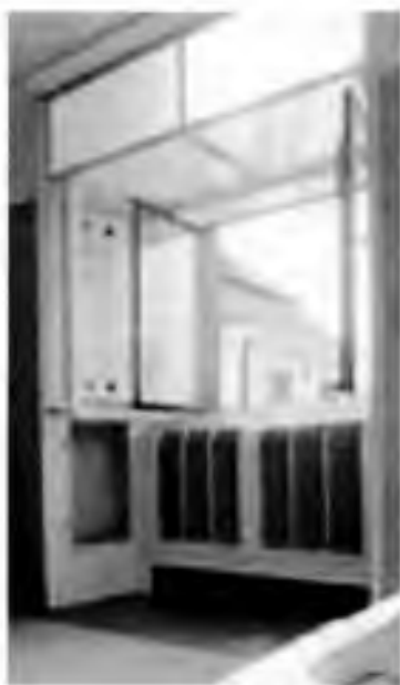
Okno Jana Masaryka