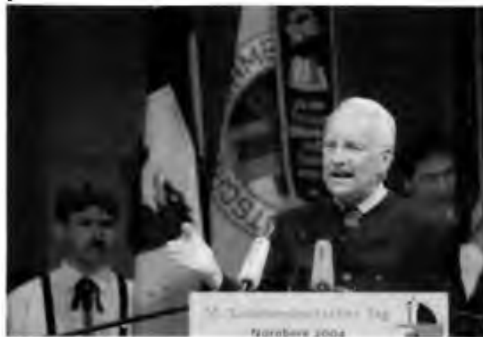
Bavorský ministerský předseda Edmund Stoiber na sudetoněmeckém srazu v Norimberku 30.5.04.

V pátek 28. května jsme vzpomněli (jak kdo) 120. výročí narození našeho druhého prezidenta dr. Edvarda Beneše. O víkendu proběhl 55. sraz sudetoněmeckého