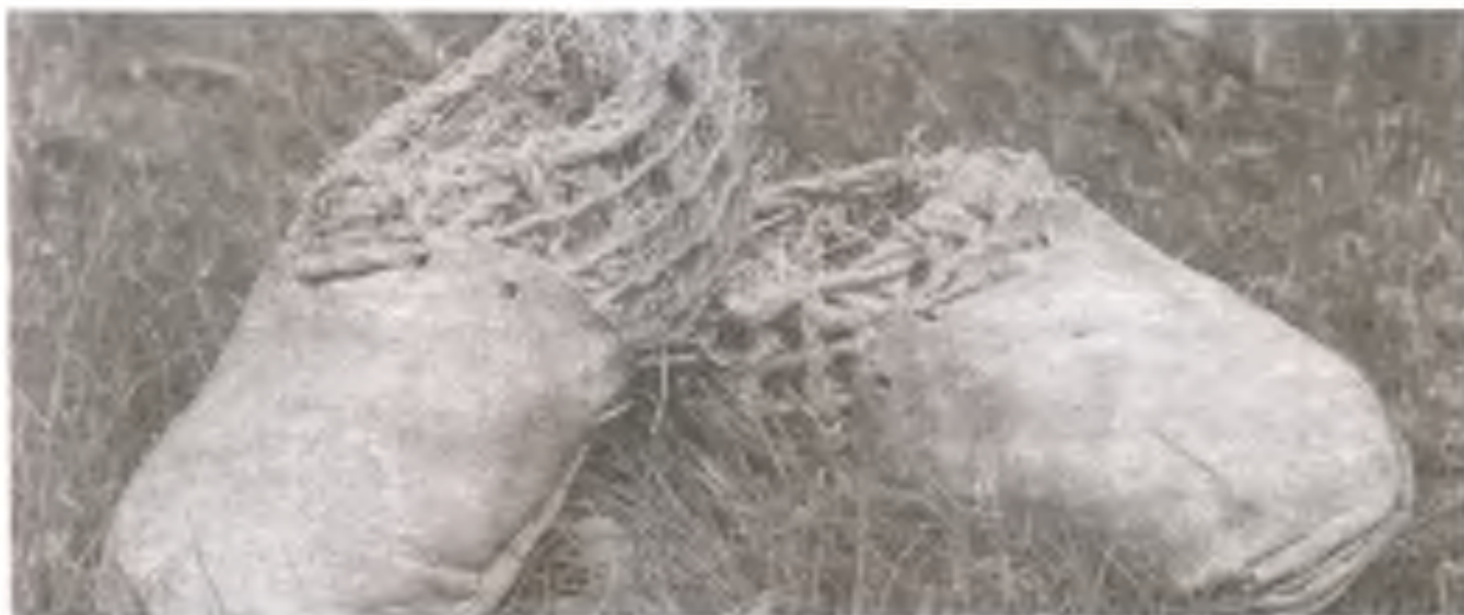
Replicas of the shoes found with Oetzi.

symbolic about the challenge being taken up at the university whose founder's name, Baťa, has been made famous by his worldwide footwear empire.