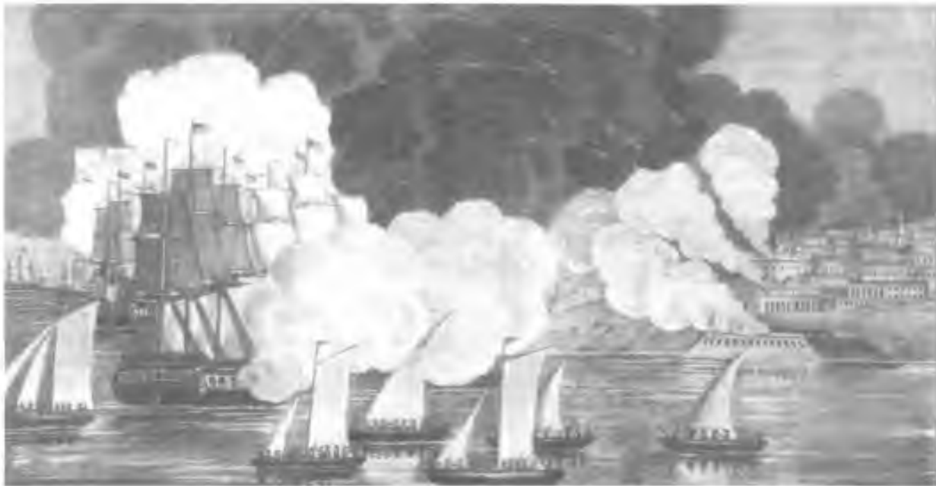
Ostřelování Tripolisu na dobové ilustraci

Analogie s novodobým tažením proti terorismu však zřejmě hned tak neskončí - pašu