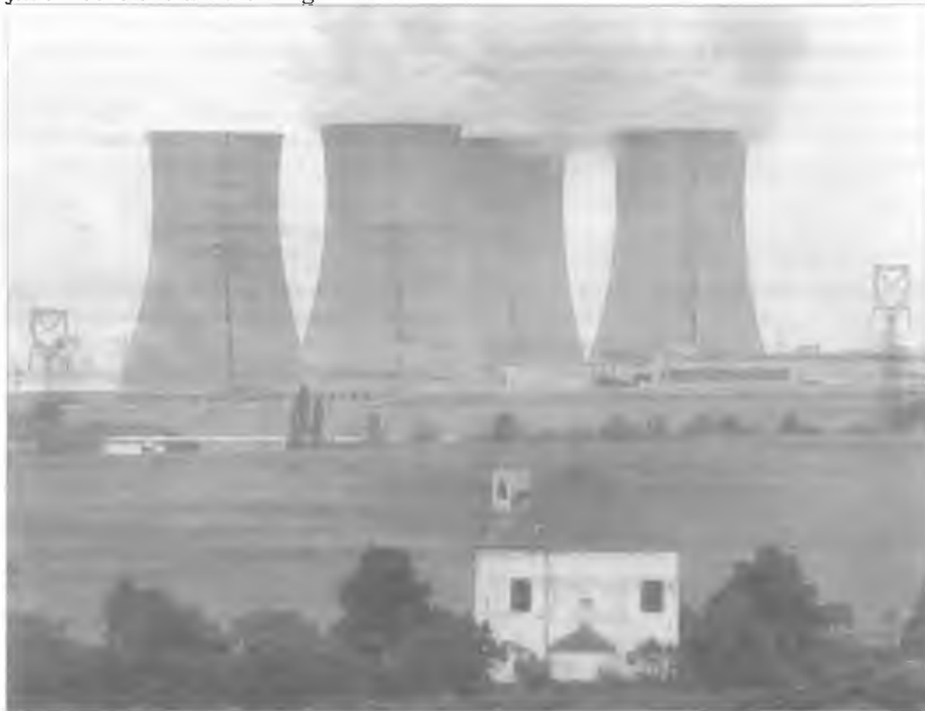
Jaderná elektrárna Dukovany.

Prudký vzestup cen fosilních energetických zdrojů, tak jako strach ze závislosti na arabských, politicky nestabilních státech, disponujících největšími ložisky ropy a závislosti na ruských plynových společnostech, způsobuje nejen v Evropě, ale i celosvětově renesanci jaderné energie. Nejnovější typy reaktorů třetí generace jsou stoprocentně jisté, říkají jejich konstruktéři a dodávají, bohužel to nemůžeme prakticky předvést. Firma Siemens již staví první jadernou elektrárnu třetí generace.