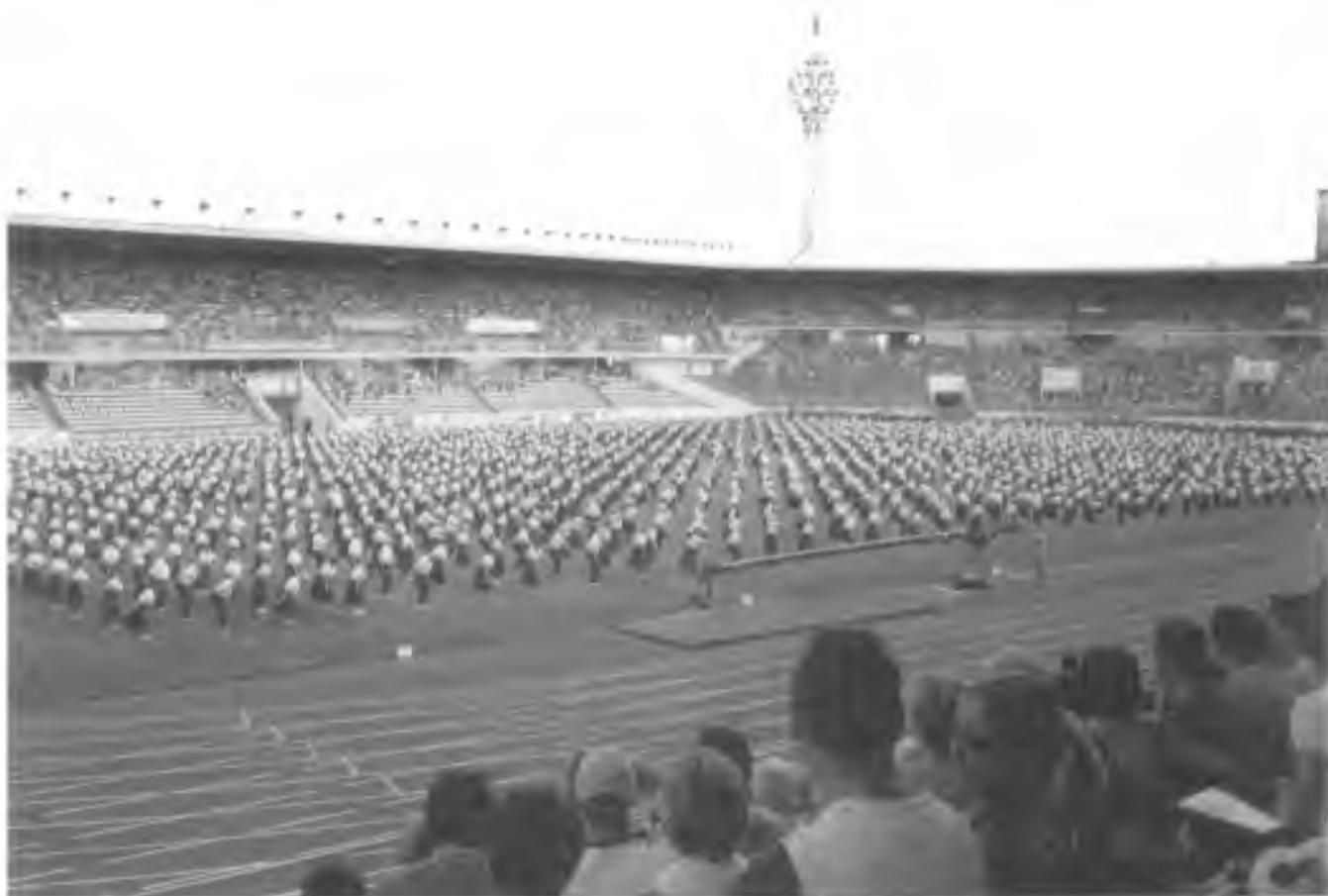
„Věrná garda“

Konečně nadešel den prvního vystoupení ve středu 5.července večer, tak zvaný I. program. Byl to krásný pocit stát ve skladbě „Léto“ na Strahovském, byť menším stadionu při zahájení a tvořit živou oponu. Mezi námi probíhaly děti, které vytvořily obraz XIV. A špalírem mezi námi prošly vlajkové čety nejprve státní pak sokolská, za ní se řadily dvojstupy bratří v historických krojích s historickými sokolskými prapory, každý doprovázen malým žákem. Nejmenší byl asi 4letý v červené košilce, plátě-