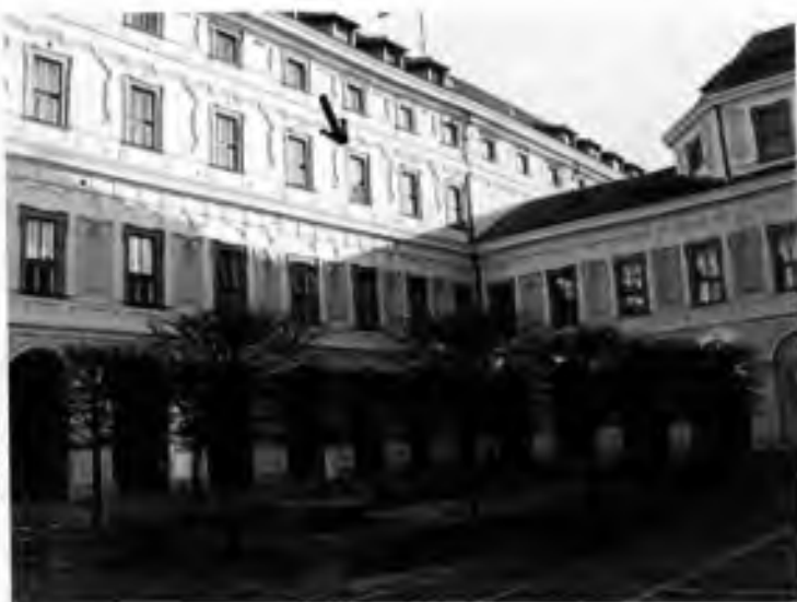
Osudné okno koupelny Jana Masaryka