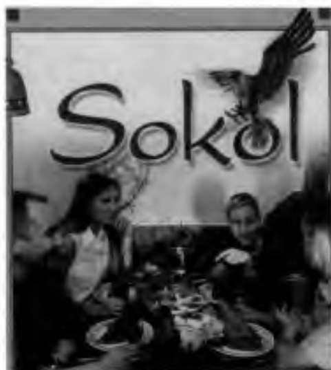
Restaurace "Sokol" v slovinské Ljubljani