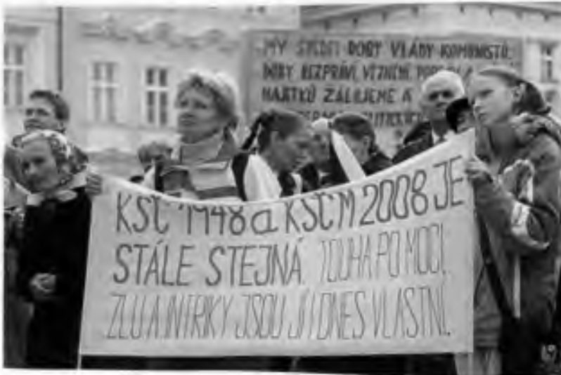
Manifestace účastníků třetího odboje, foto: ČTK

spoustu lidí, proto festival bude pořádán každoročně, i když my tady už nebudeme. Protože se ho ujímají mladí lidé a mezi mládeží to má stále větší a větší ohlas. Děti nebo studenti se vyjadřují, co to pro ně znamená totalita. Takže festival bude pokračovat.