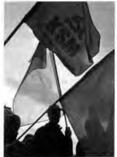
Demonstrace proti vládě, za socialismus a k 60. výročí únorových událostí v roce 1948 pořádaná KSČM, foto: ČTK

Profesor Mojmir Povolný ze Spojených států, který byl přímým účastníkem únorového převratu a v roce 1948 odešel do exilu, vidí příčiny poválečného vývoje a komunistického převratu v Československu ještě hlouběji: "Já vidím ten klíč v Mnichově. Já se domnívám, že pravděpodobně dosud není vědomí toho, do jaké míry té mladé republice a mladému politickému československému národu Mnichov podtrhl nohy."