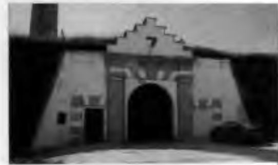
Brána do věznice Leopoldov

"My jsme vlastně začali už kolem 25. února," říká ve filmu česko-kanadské televize. V prvé řadě musel zlikvidovat důvěrné materiály o skautském hnutí, národních socialistech a lidovcích, které se nesměly dostat do rukou komunistům.