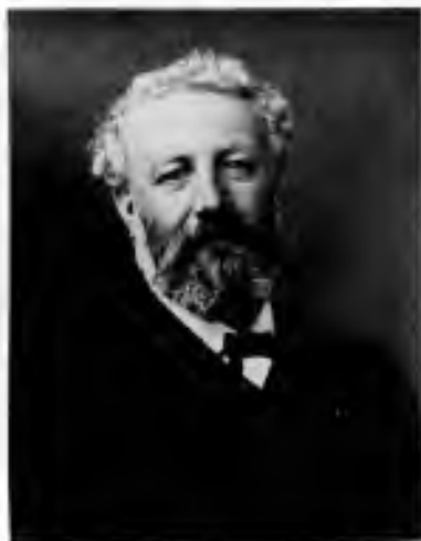
Jules Verne

Škrob - Školní kroužkový občasník únor 2008