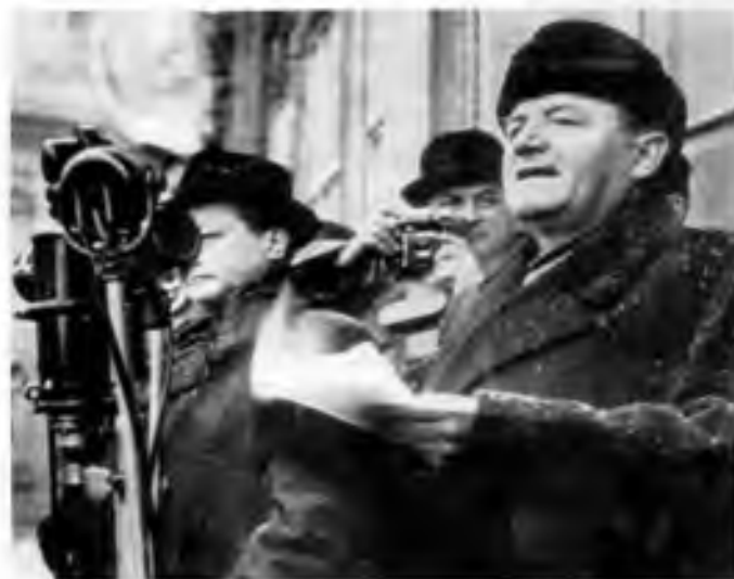
Klement Gottwald při projevu na Staroměstském náměstí v únoru 1948, foto: ČTK

Milena Štráfeldová www.radio.cz 26-2-2008