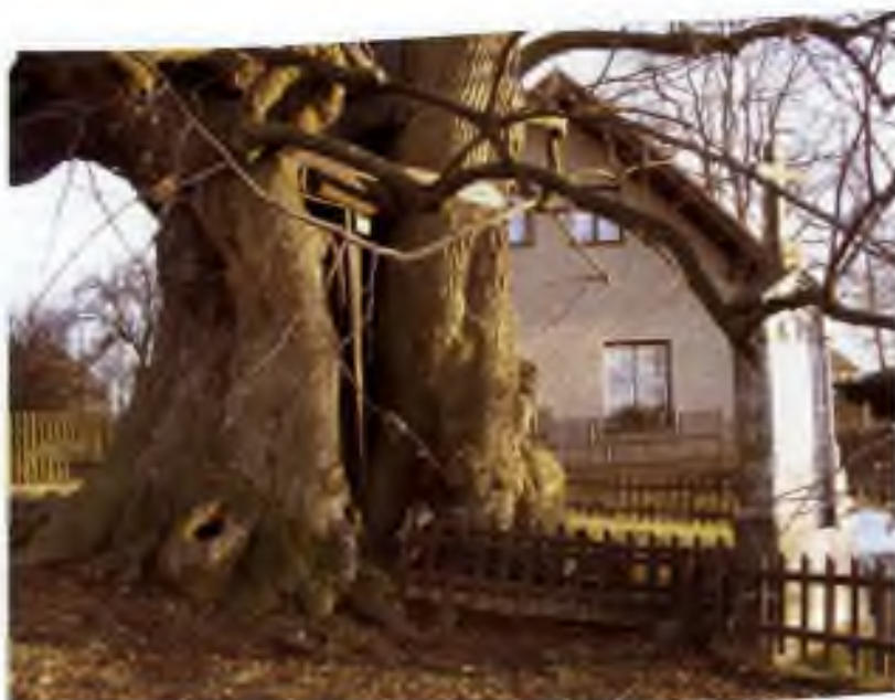
Skoro tisíciletá lípa v Klokočově pamatuje Karla IV

Ó lípy české, žijte dál pro české děti jiné! Kéž národ našich předků s vámi nezahyne----