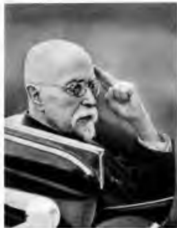
T. G. Masaryk

nýbrž sledoval bedlivě také politické dění a vyjadřoval se k němu. Ještě dlouho po vypuknutí první světové války zastával stanovisko, že rakouské soustátí by se nemělo rozpadnout, jediné tak totiž mohlo podle Pekaře úspěšně čelit tlaku silného německého souseda. Pekařovým nejznámějším počinem však bylo rozpoutání tzv. „sporu o smysl českých dějin“, který se rozhořel především mezi ním a T. G. Masarykem. Zapořila se do něj většina tehdejší historické obce a sledovala jej i širší veřejnost. Hlavní jádro sporu spočívalo v otázce, jaký je smysl českých dějin, jaký má být jejich správný výklad.