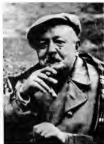
Jos Pekař v r. 1934