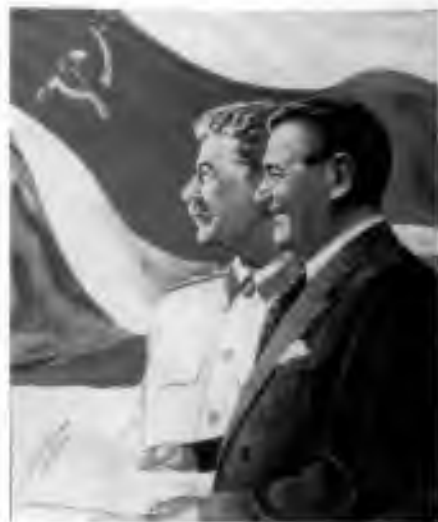
J.V.Stalin a K.Gottwald