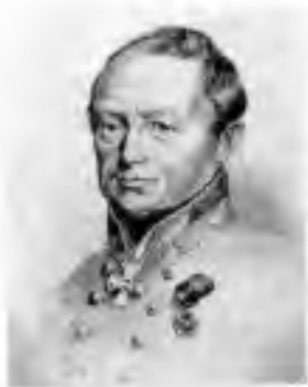
J V Radecký

Do parčíku mezi Národním divadlem a Staroměstskými mlýny se do pseudogotické věže vrátila jezdecká socha staříckého mocnáře France Josefa , která ztrávila téměř devadesát let v lapidariu Národního musea. František Josef rozhodně nebyl přítelem sokolů, ani Čechů. Povolal do Rakouské armády 800.000 mladých českých mužů, z nichž 100.000 na frontě padlo. A na Malostranské náměstí se brzy navrátí socha maršálka Josefa Václava Radeckého z Radče, který byl ale Čech a snad i dobrý válečník. No budiž. To, že obě sochy, které byly odstraněny v okamžiku znovuzískané samostatnosti a pak uloženy ve sklepeních Národního musea napovídá něco o našem národním charakteru. Stačí si připomenout třeba vyvraždění carské rodiny bolševiky včetně malých dětí.