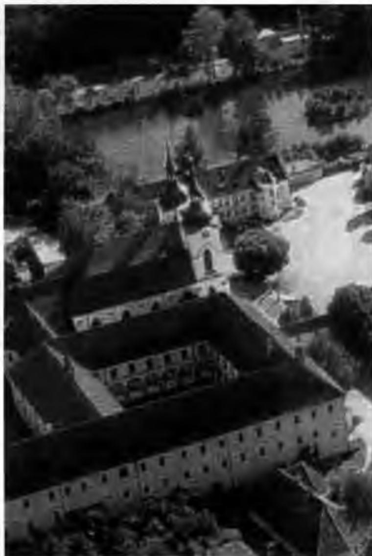
Želiv - nové působiště pátera Šimka (strana 21)

THE SOKOL SYDNEY PROGRAMME OF ACTIVITIES MAY BE HEARD ON 02 9452 5617