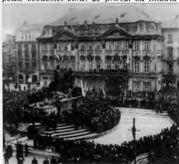
Staroměstské náměstí únor 1948