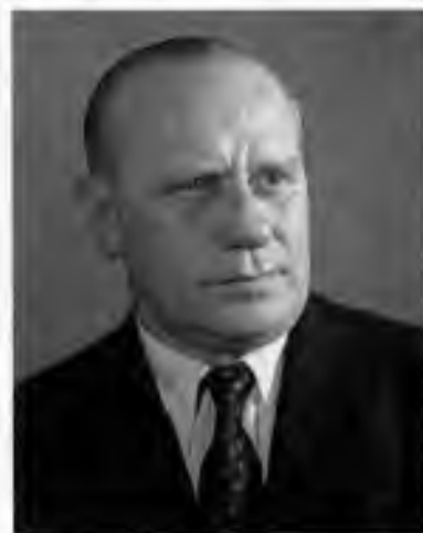
Václav Nosek

Komunistické převzetí moci se připravovalo delší dobu. Vyvrcholení nastalo v únoru roku 1948. Nekomunističtí ministři v Gottwaldově vládě uložili ministru vnitra Noskovi, aby zastavil plánované přemístování obvodních velitelů Sboru národní bezpečnosti v Praze ve prospěch komunistů. S napravením poměrů v Bezpečnosti spojili nekomunistické strany otázku svého dalšího setrvání ve vládě. Václav Nosek však odmítl podřídit se nařízení vlády a ministři tří nekomunistických stran podali 20. února demisi. Tato demise se pak stala impulsem pro Gottwalda a celé komunistické vedení, aby spustili akce na převzetí absolutní vlády v Československu.