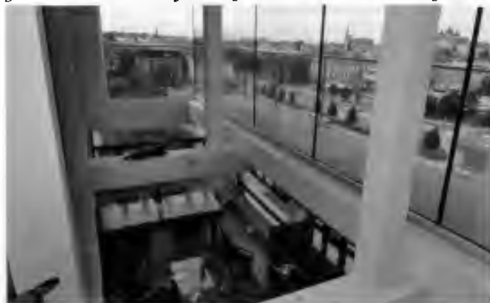
Stavba připomínající lidem orlí hnízdo totiž sbírá jedno ocenění za druhým.