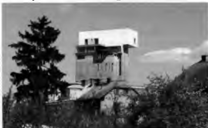
Vila na vrcholku silážní věže je dalším příkladem přeměny průmyslových objektů na bydlení.

Když se dozvěděl, že je na prodej, koupil ho. Získal tím lukrativní místo téměř v centru Olomouce.