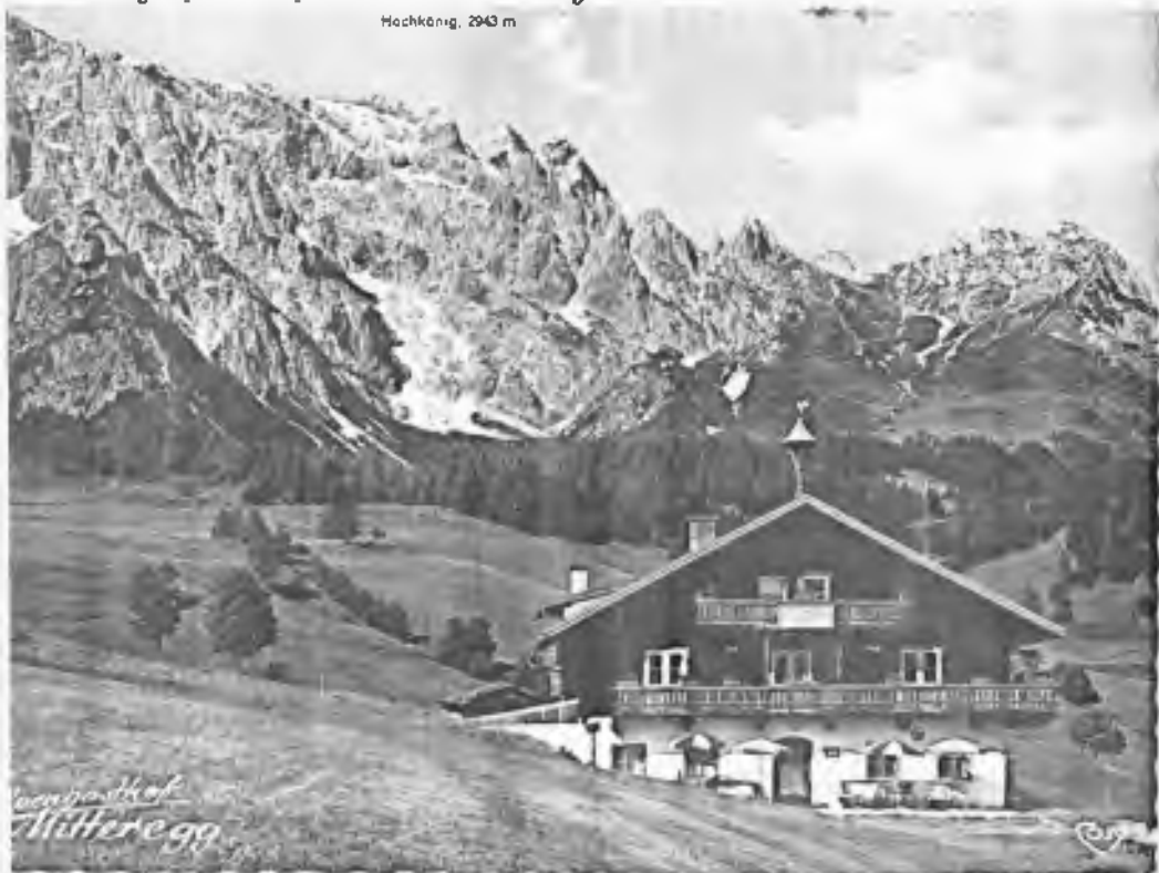
Hochkäng. 2940 m

Nechci se ani příliš zmiňovat o zámečku Esterházy ve Wittau u Vídně, který je dosažitelný pouliční dráhou a pak 4 km autobusem. Ten byl Českému srdci nabídnut za 3,000.000 S a určitě by se koupě byla nerealizovala za více než 2,500.000 S. Ten by býval - patřil k němu totiž malý hotel a pozemek /sad/ o výměře 14.000 m 2 - sloužil opravdu celé menšině; dětem i starším krajanům a krajanům, kteří by tam bývali trávil aspoň 2 týdny dovolené, a rovněž sportovcům, neboť na pozemku byly i 2 velké haly pro sportovní účely.