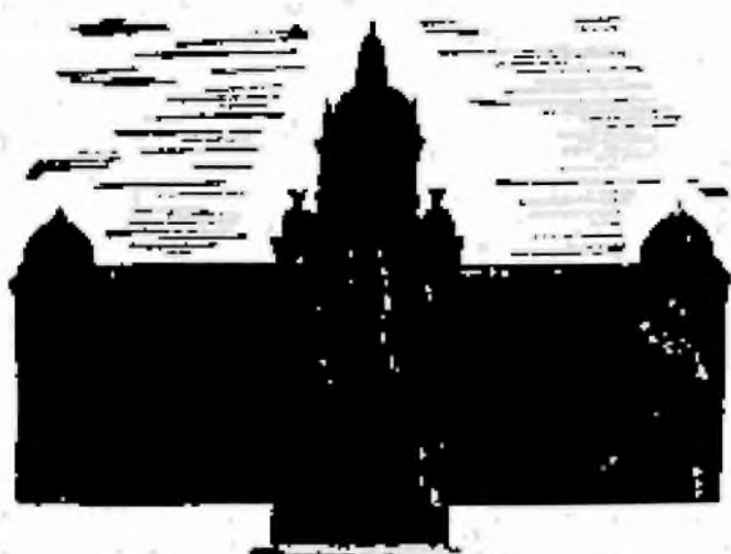
JUBILEUM NÁRODNÍHO MUSEA